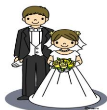
結婚資金の準備に…