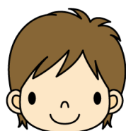
子供の教育資金に…