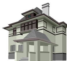
住宅購入の頭金に…